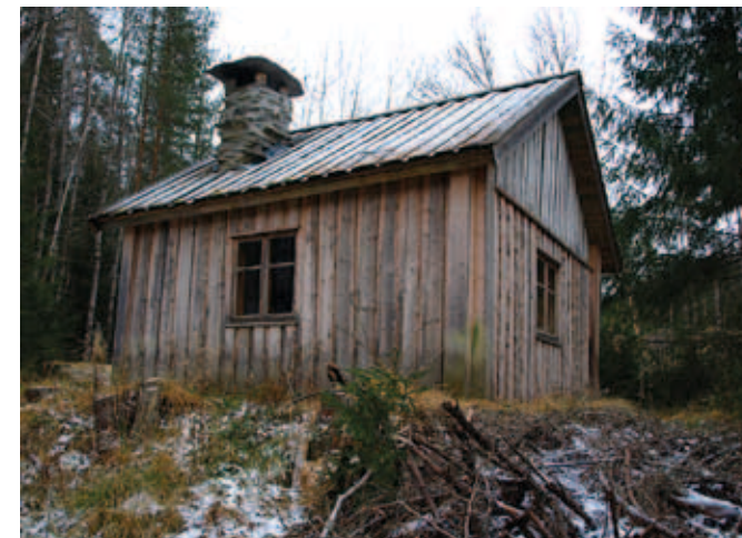
I Marker kommun i Østfold på gränsen mot Sverige ligger ett område som i trakten kallas Fantebyen. I mitten av 1800-talet bosatte sig här ett antal personer som var av resandesläkt. Ett hus, Jørnehaugen, är bevarat och öppet för allmänheten.

Det material som samlas in presenteras i webbportalen Den skandinaviska resandekartan / Det skandinaviske reisendekartet . Basen för portalen är en karta som sträcker sig över den svensknorska riksgränsen. Kopplat till denna finns en databas med uppgifter om inventerade platser. Databasen kan hela tiden byggas ut med ny information. Genom portalen kan man söka efter platser med anknytning till resandefolket samt finna information om resandefolkets historia i