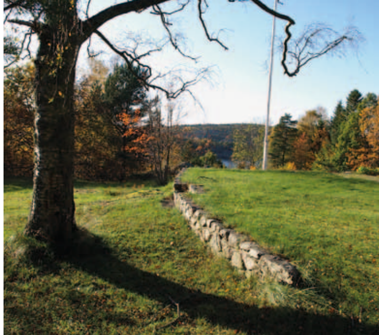
I Sponvika, nära svenska gränslinjen i Idefjorden, ligger en plats som fram till skiftet mellan 18- och 1900-talen användes av resandefolket som lägerplats. De fast boende i Sponvika kallade den Taterløkka.

Målet med projektet är att lokalisera, inventera och dokumentera ett antal platser med anknytning till resandefolket i de svensknorska gränstrakterna. Det rör sig om fasta boplatser, om övernattningsplatser som använts för längre och kortare tider under handelsresor, liksom speciella rutter som olika familjer använde på sin färd mellan olika